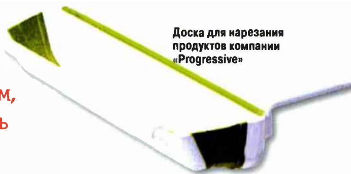
Доска для нарезания продуктов компании «Progressive»

давливает вдвое больше сока, чем любой другой аналогичный прибор.