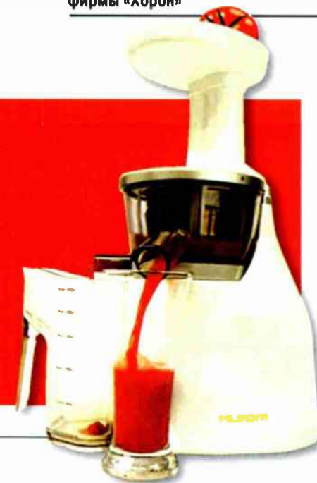
Суперсоковыжималка фирмы «Хорон»

ливались только в трех цветах: белом, черном, сером. Немарко, неброско, одним словом, практично. Первой фирмой, разбавившей унылую гамму, была «Kitchenaid». Именно ее алый миксер произвел революцию в окраске домашних приборов. Он появился в магазинах в 1994 году. С тех пор фирма не раз экспериментировала с цветом, предлагая покупателям блендеры оттенков «мандарин», «зимнее небо», «благородный желтый», «жемчужный металл». В 2008 году к ним добавились лиловый, шоколадный и перламутровый. Сегодня креативные цвета перестали быть товарной маркой одной фирмы. Другие компании тоже вводят новые оттенки. И похоже, в ближайшие годы эта мода захватит наши кухни. Правда, специалисты на чикагской выставке призвали производителей проявлять чувство меры. Слишком дерзкие цвета, по их мнению, могут оттолкнуть покупателя. Ведь если через пару лет они выйдут из моды, хозяйке придется обновлять либо приборы, либо окраску кухни. Что ж, цвет - дело вкуса, и, скорее всего, последнее слово в этом споре скажут потребители.